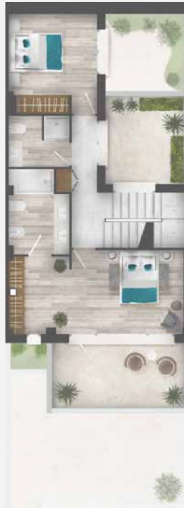
Planta Primera | First Floor

Dormitorio principal Master bedroom: 20.37 m 2 Baño secundario Second bathroom: 4.39 m 2 Terraza - salón Terrace - living room: 33.56 m 2 Dormitorio secundario Second bedroom: 11.02 m 2 Salón Living room: 27.71 m 2 Terraza - dormitorio Terrace - bedroom: 12.75 m 2 Baño principal Master bathroom: 6.75 m 2 Comedor Dining room: 9.34 m 2 Cocina Kitchen: 11.12 m 2