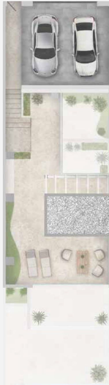
Planta Acceso | Access floor