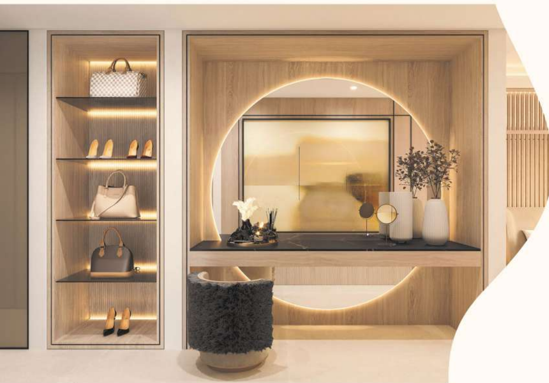
Warm & modern Texture & simplicity