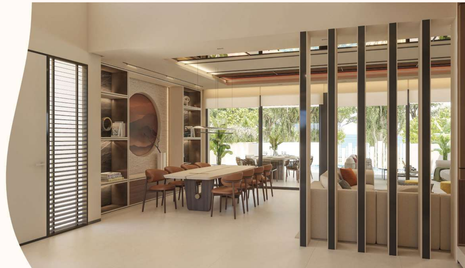
Living Room & dining area