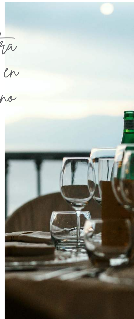
In the heart of the Costa del Sol En el corazón de la Costa del Sol