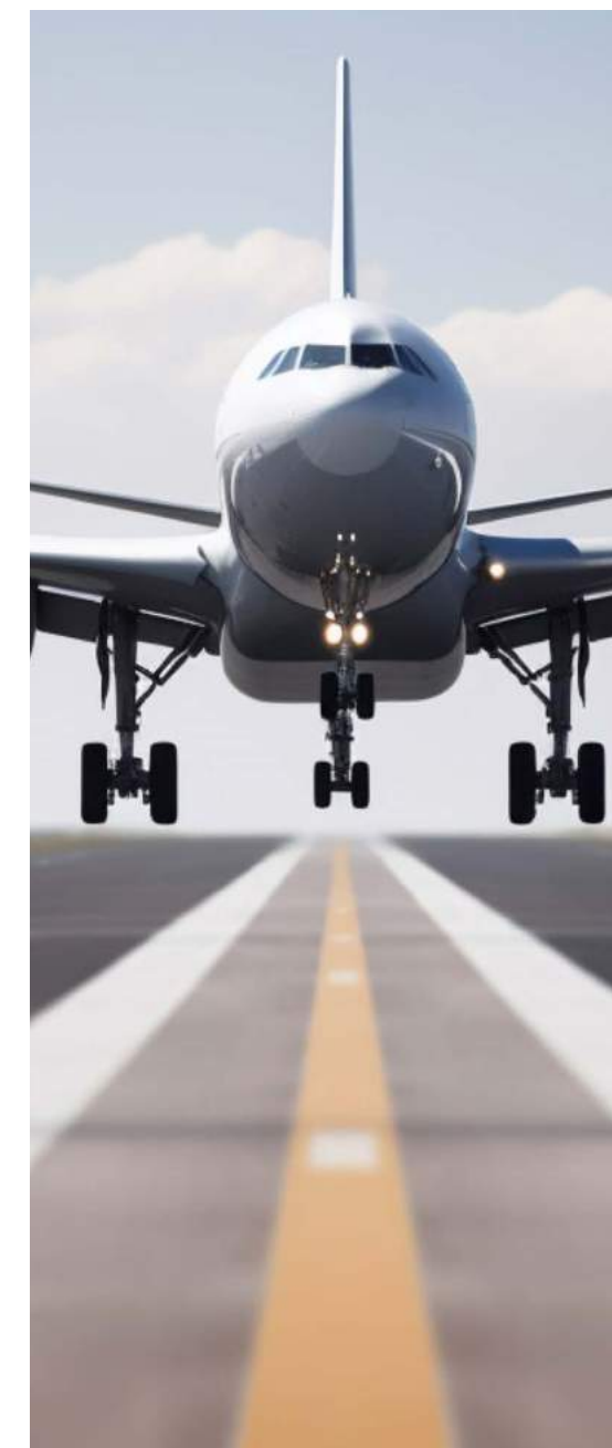
22 min from Malaga International Airport A 22 min del Aeropuerto Internacional de Málaga