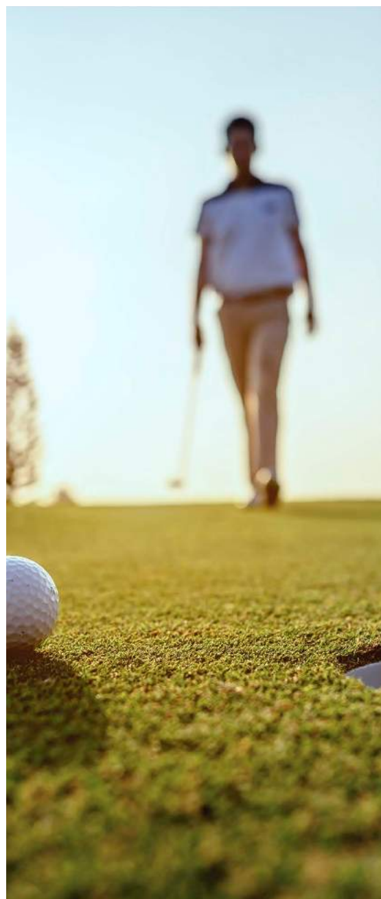
6 golf courses within a 15 km radius 6 campos de golf en un radio de 15 km