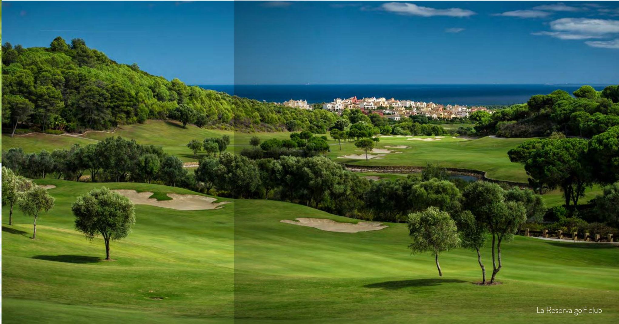
La Reserva golf club

A pocos minutos encontramos Estepona Golf, con increíbles vistas al mar y otros campos de golf de renombre internacional están a unos 15 minutos, dirección oeste como Valderrama, La Reserva, y dirección este a 20 minutos, el famoso valle del golf, en Marbella.