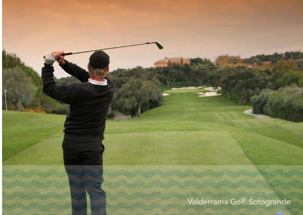
Valderrama Golf. Sotogrande