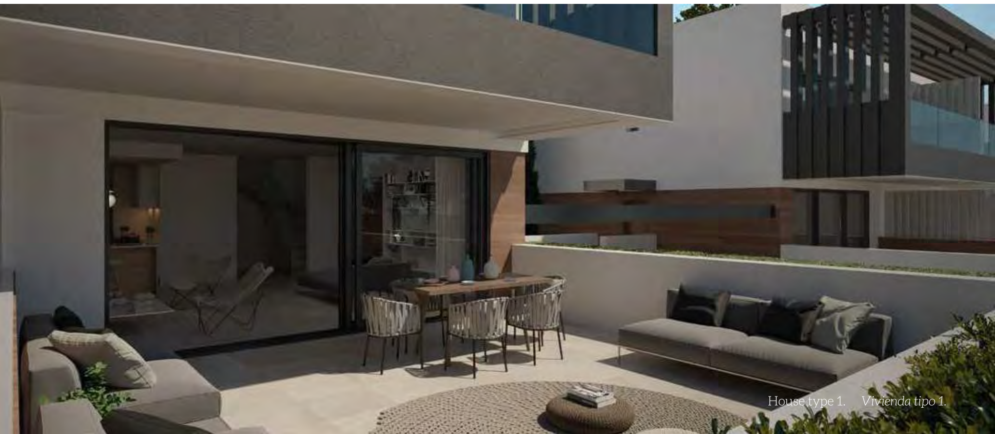
House type 1. Vivienda tipo 1.